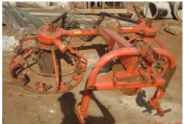
Vista parcial do conjunto de implementos